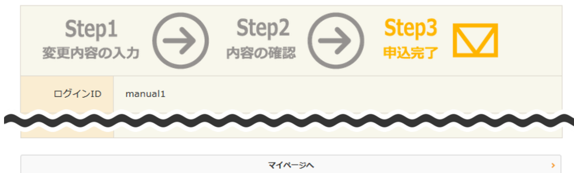
図 21：利用者情報変更（完了）画面