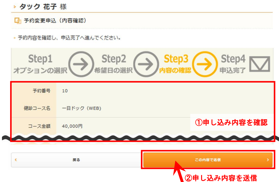
図 15：予約変更申込（内容確認）画面

ここでは、変更申し込みの内容が確認できます。内容に誤りがないことを確認した上で、「この内容で送信」をクリックしてください。予約変更の申し込みが施設に送信されます。