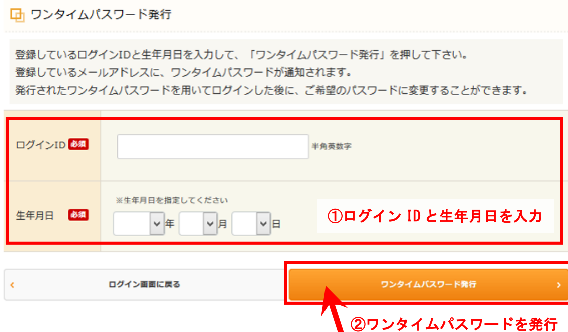
図 22 : ワンタイムパスワード発行画面

本人確認のため、ワンタイムパスワードによる認証を行います。ログイン ID と生年月日を入力して、「ワンタイムパスワード発行」をクリックしてください。