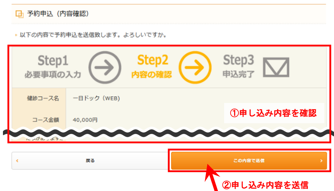
図 9 : 予約申込 (内容確認) 画面

入力内容に誤りがないことを確認した上で、「この内容で送信」をクリックしてください。予約の申し込みが施設に送信されます。