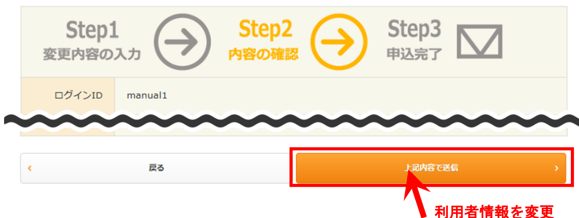
図 20：利用者情報変更（内容確認）画面