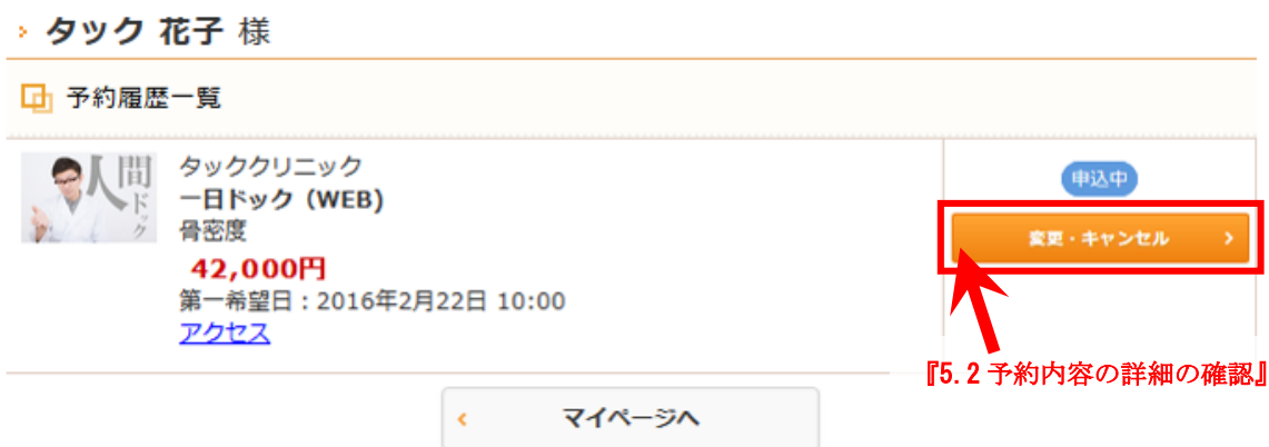
図 11：予約履歴一覧画面

ここでは、予約履歴を確認できます。予約中の内容の詳細を確認される方、あるいは、予約の変更申し込みや予約のキャンセルをされる方は、「変更・キャンセル」をクリックしてください。予約内容詳細画面が表示されるため、次の『5.2 予約内容の詳細の確認』を参照してください。