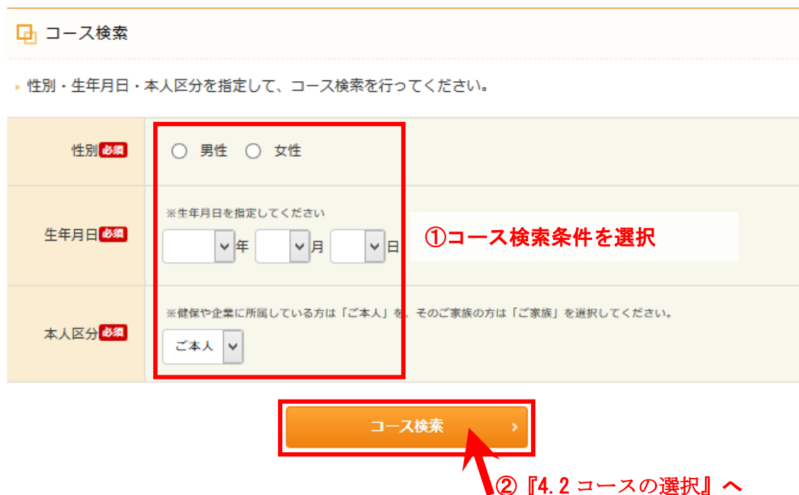
図 3 : コース検索画面