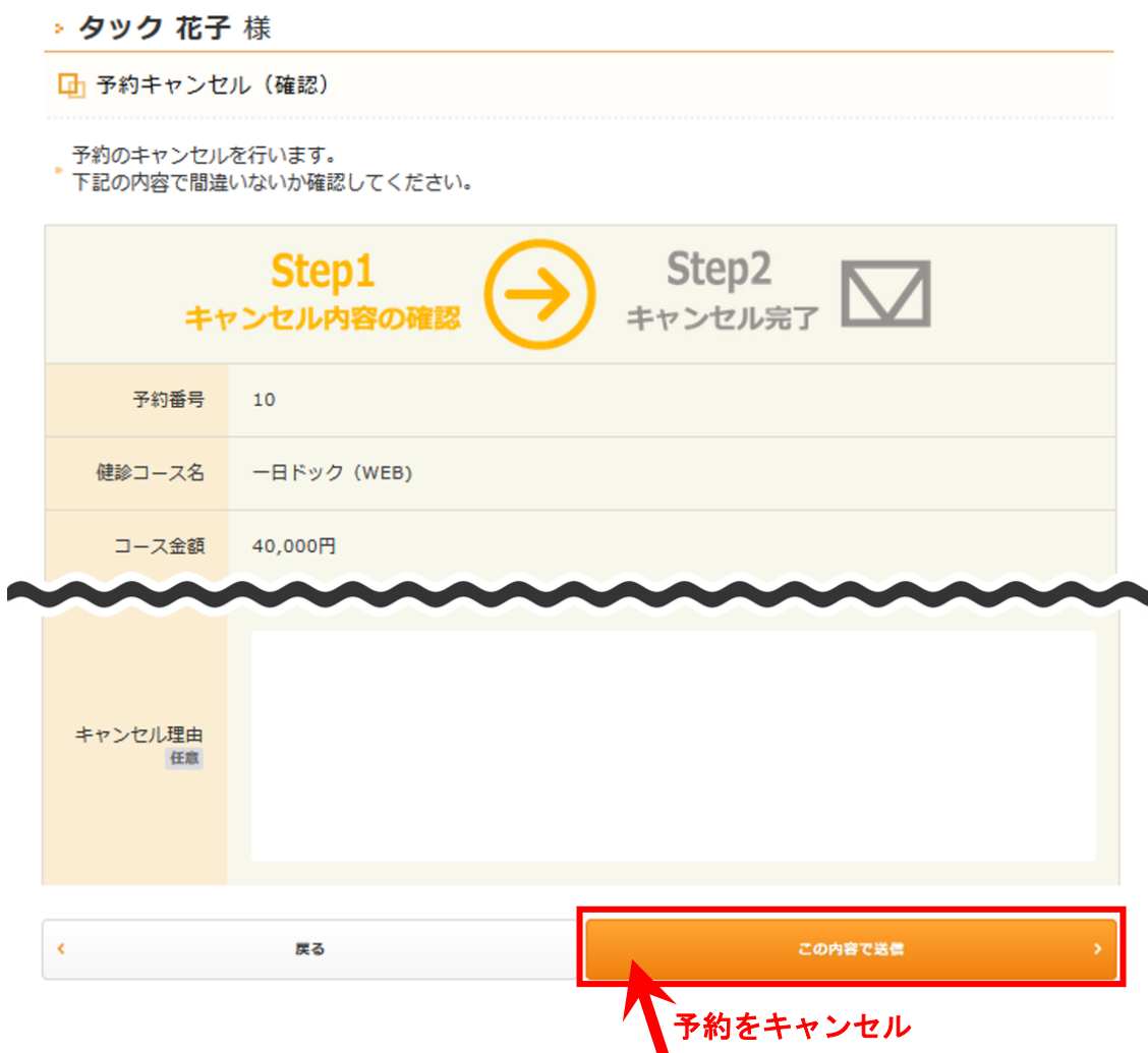
図 17：予約キャンセル（確認）画面

ここでは、キャンセルする予約の内容を再度確認できます。キャンセルを希望する予約であることを確認した上で、「この内容で送信」をクリックしてください。予約がキャンセルされます。