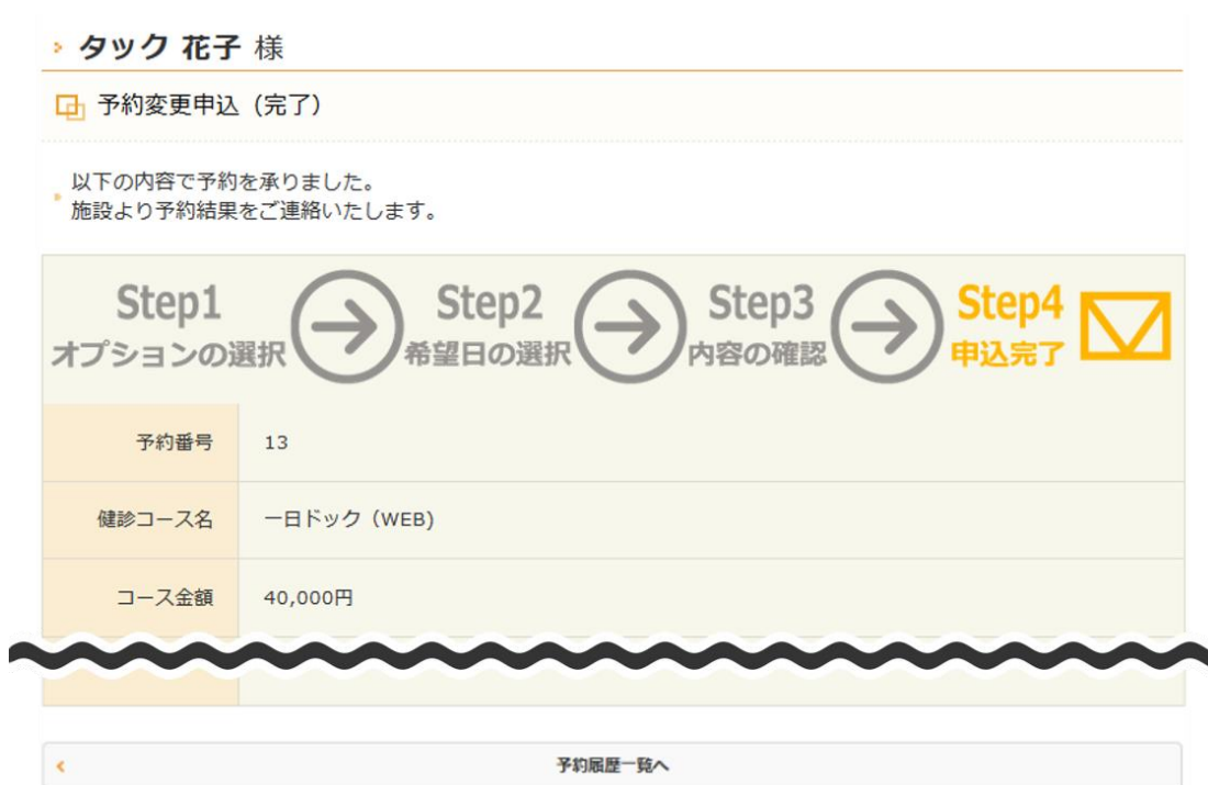
図 17：予約変更申込（完了）画面