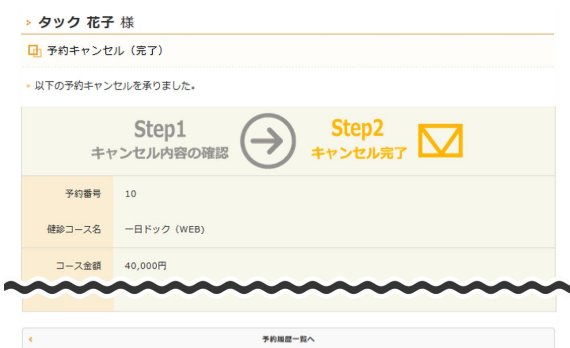
図 19：予約キャンセル (完了) 画面