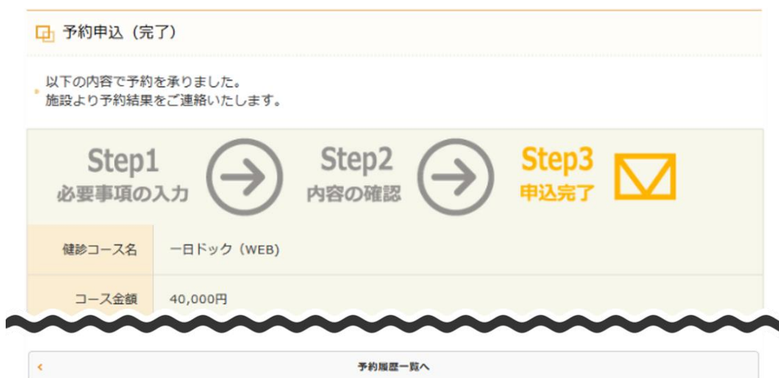
図 11：予約申込（完了）画面