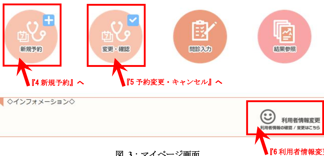
図 3 : マイページ画面