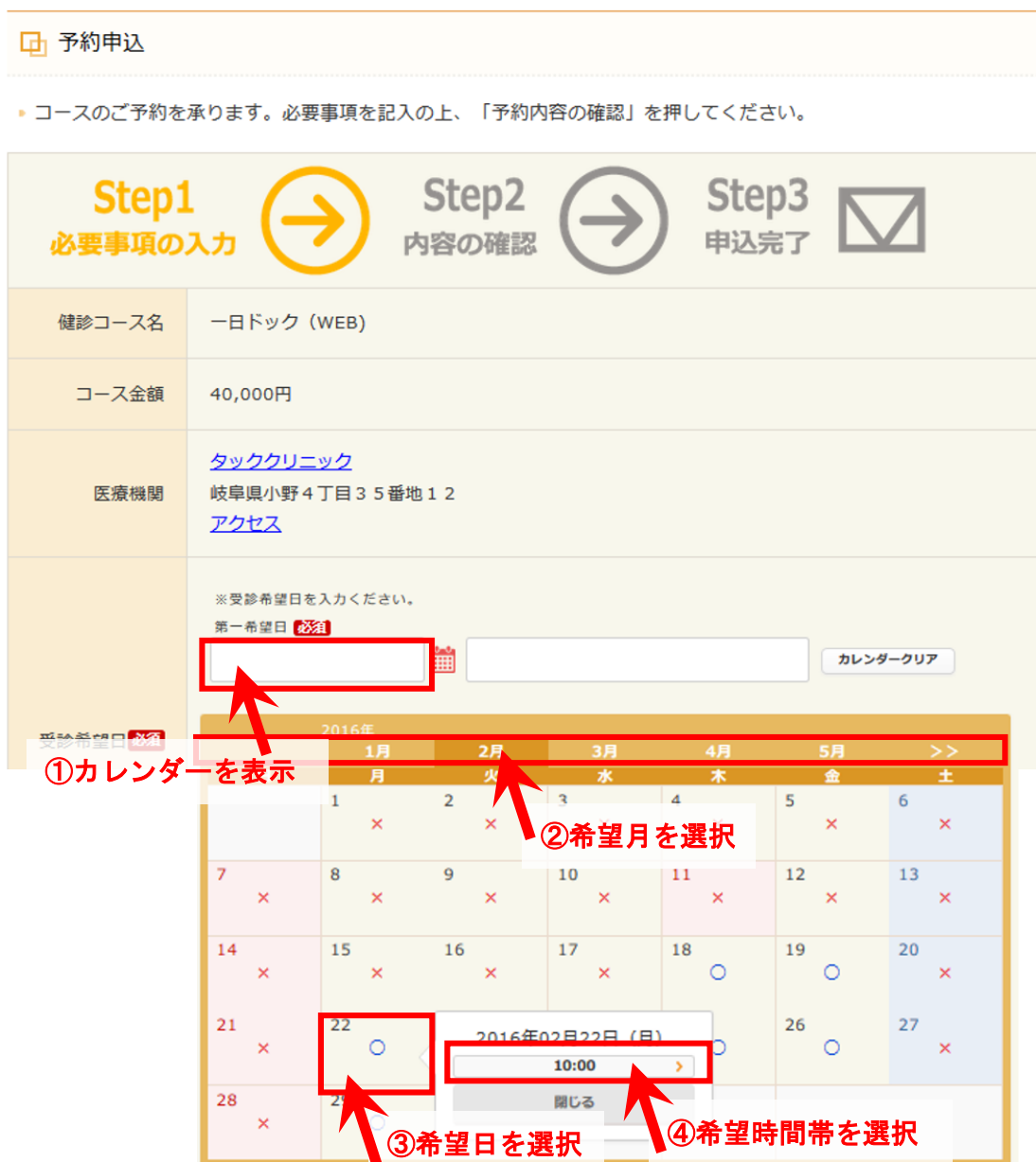
図 8：予約申込画面（受診希望日の選択）