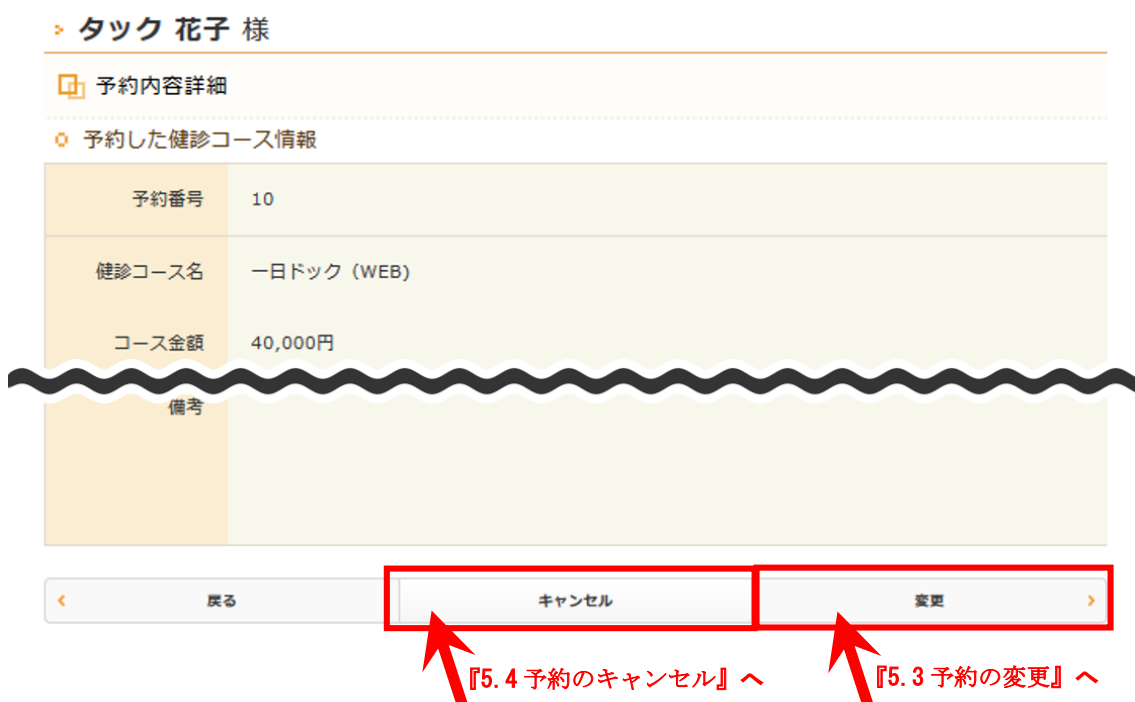
図 13 : 予約内容詳細画面