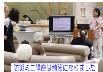
防災ミニ講座は勉強になりました