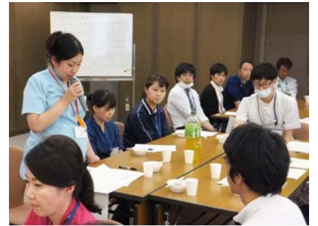
グループワークでは多くの意見交換が行われました

こちらの部では『在宅支援医療で一人暮らしの患者さんを元の生活の場に戻すための退院支援』について、ケアマネージャーの皆さまと当院の看護師、MSW、理学療法士、栄養士等で、グループワーク形式による意見交換を行いました。開催後のアンケートからは、他職種やケアマネージャー間での意見交換ができて良かった、病院スタッフとの情報共有ができたこと他に、退院前の患者指導に立ち会いたい、担当者会議をもっと早期に行いたいなど積極的なご意見も頂きました。昨年度は88の施設様から、1347回の患者訪問を頂き、担当者会議をはじめとする連携を図りました。「交流会の顔ぶれも、顔見知りになってきたため意見交換しやすくなった。」とうれしい意見も頂くことができました。今後、国はさらに地域との連携体制を重要視してくると思われます。当院も地域医療・介護連携のために、様々な方法で顔の見える連携を目指してまいります。