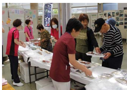
どの特産品もおもしろそう！迷っちゃいます。