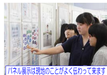
パネル展示は現地のことがよく伝わってきます