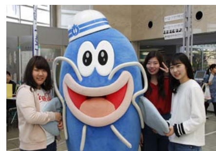
「防災ナマズン」はもうお馴染みとなっています！