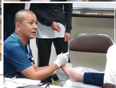
正しい爪きりの方法