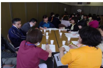
昨年度の講演・グループワークの様子

在宅へ退院される患者さんの支援を行ってくださるケアマネージャーの皆様とより親交を深め、スムーズな連携ができるよう意見交換、情報共有を行う目的で、下記のとおり交流会を開催します。参加申込みは、地域医療連携室までお願いします。